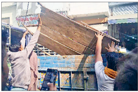
महेंद्रगढ़। सामान का ट्रॉली में डालते कर्मचारी।

नगर पालिका ने शुक्रवार दोपहर को शहर में अतिक्रमण के खिलाफ बड़ी कार्रवाई की। टीम ने विभिन्न बाजारों में छापेमारी कर दुकानों के बाहर पड़ा सामान जब्त किया और अतिक्रमण हटाया। इसके अलावा टीम ने विभिन्न दुकानदारों के पालिथीन रखने पर चालान काटे। नगर पालिका अधिकारियों के निर्देश पर चलाए गए अभियान का उद्देश्य सड़कों को खाली करना और यातायात जाम से निजात दिलाना है। वहीं अतिक्रमण विरोधी टीम ने मुख्य बाजारों के दुकानदारों को अपनी दुकानों के बाहर सामान न रखने की सख्त हिदायत दी। इस दौरान कई दुकानों के बाहर पड़ा सामान जब्त किया गया। यह अभियान नगर पालिका कार्यालय से शुरू होकर शंकर मार्केट, बालाजी चौक, विश्वकर्मा चौक, सीएसडी कैम्प, बस स्टैंड, राव राव तुलाराम चौक होते आईटीआई रोड अंबेडकर चौक से नगर पालिका कार्यालय में जाकर समाप्त हुआ। इसके साथ ही आगे से रोड पर