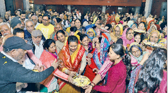
भिवानी। श्रीकृष्ण कथामृत में शामिल श्रद्धालु।