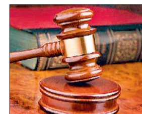
दुकानों में लाइसेंस न होने, मिसब्रांड व सबस्टैंड सामान मिलने पर सुनवाई