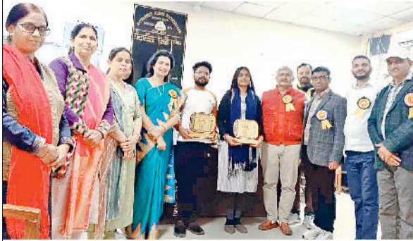
महेंद्रगढ़। विजेताओं को सम्मानित करते हुए।