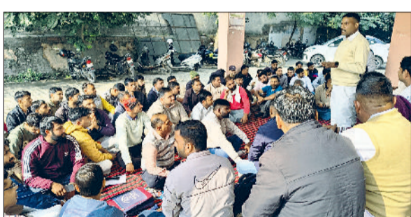
भिवानी। आयोजित धरने का संबोधित करते एक वक्ता।

चरखी दादरी। उपायुक्त डॉ. मुनीष नागपाल ने जानकारी देते हुए बताया कि 27 नवंबर को जिला कष्ट निवारण एवं परिवेदना समिति की बैठक का आयोजन किया जाएगा। प्रदेश के कृषि एवं किसान कल्याण मंत्री श्याम सिंह राणा बैठक की अध्यक्षता करेंगे। उन्होंने बताया कि बैठक सुबह 9 बजे लघु सचिवालय के प्रथम तल स्थित सभागार में आयोजित की जाएगी। बैठक के दौरान समिति के समक्ष आई शिकायतों को सुनते हुए उनके तुरंत निवारण का प्रयास किया जाएगा। बैठक में कृषि मंत्री के समक्ष कुल 14 शिकायतें रखी जाएंगी, जिनमें 8 लिखित व 6 नई शिकायतें शामिल हैं।