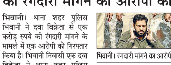
भिवानी। रंगदारी मांगने का आरोपी।