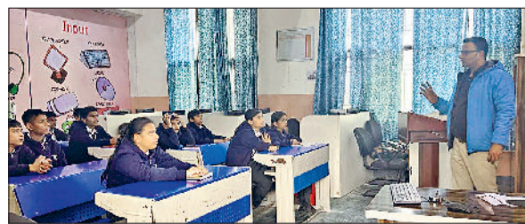
चरखी दादरी। बच्चों की एआई की ट्रेनिंग देते ट्रेनर।

जिले के सरकारी स्कूलों में एक नया प्रयोग शुरू किया गया है। इसके लिए जिला के स्कूलों में एआई यानी आर्टिफिशियल इंटेलिजेंस का प्रशिक्षण दिया जा रहा है। हरियाणा सरकार के निर्देशों के अनुसार अगले शिक्षा सत्र 2026 से स्कूलों में आर्टिफिशियल इंटेलिजेंस की पढ़ाई भी शुरू होने जा रही है। उपायुक्त डॉ. मुनीश नागपाल के मार्गदर्शन में जिला में निर्धारित समय से पहले ही इसको अमलीजामा पहनाना का जिम्मा एसडीएम योगेश सैनी को दिया गया