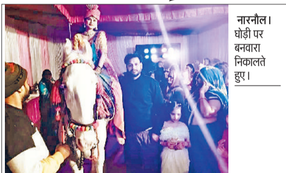
नारनौल। घोड़ी पर बनवारा निकालते हुए।